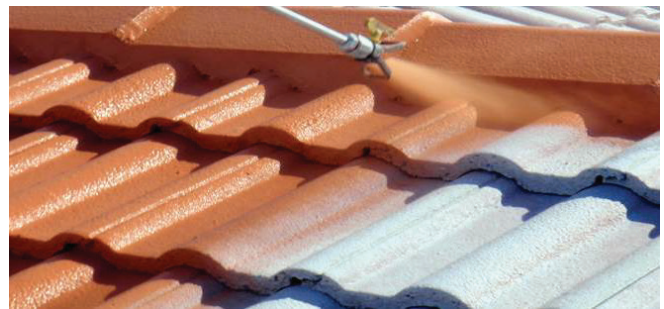
Idéal pour la rénovation des toitures